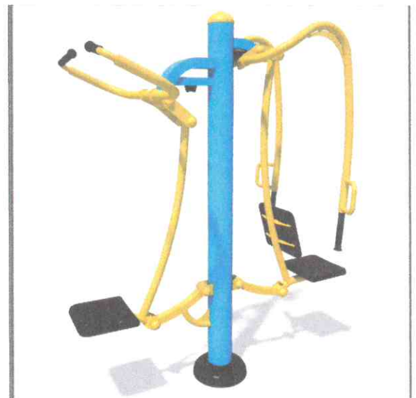
Жим сидячи від грудей (тяга зверху)