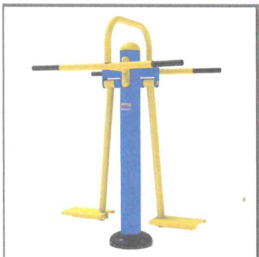
Тренажер для сідничних м'язів